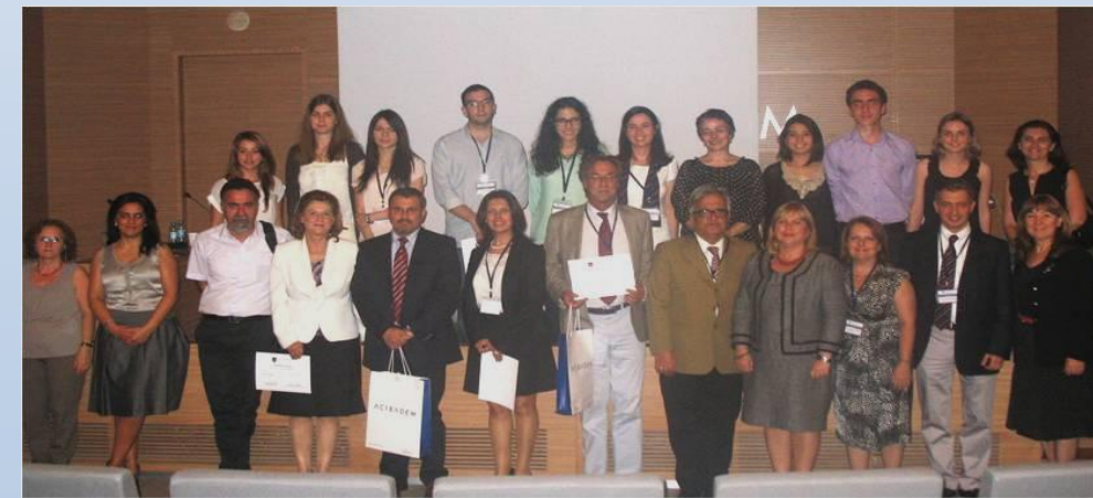
“Diyabet: Deneysel ve Klinik Yaklaşımlar Sempozyumu”nda konuşmacılar, organizasyon ekibi ve katılımcılardan bir bölüm.