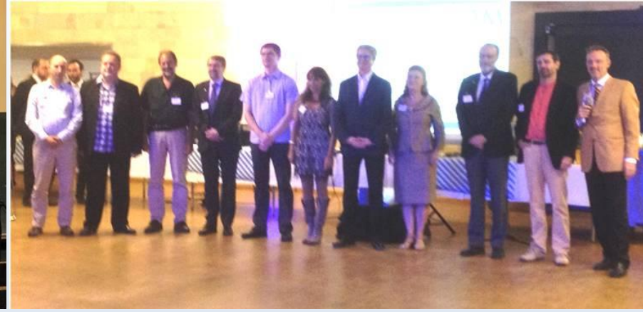
MC 2013 kongresini düzenleyen Derneklerin Başkanları kongre gala gecesinde.