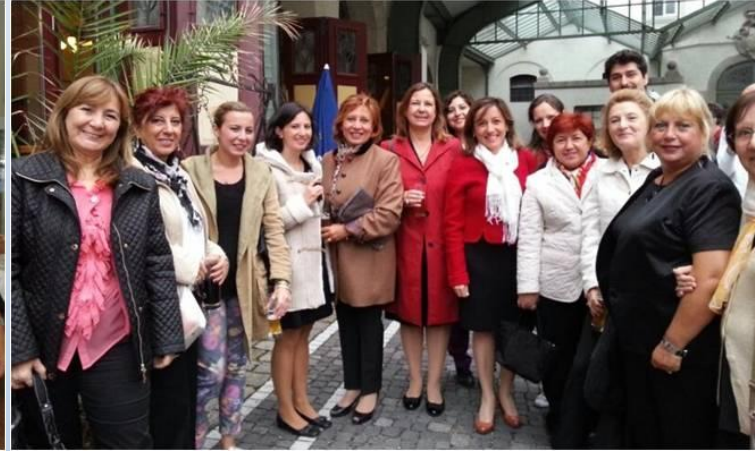
MC 2013 Kongresin'de Türk katılımcılar ile birlikte